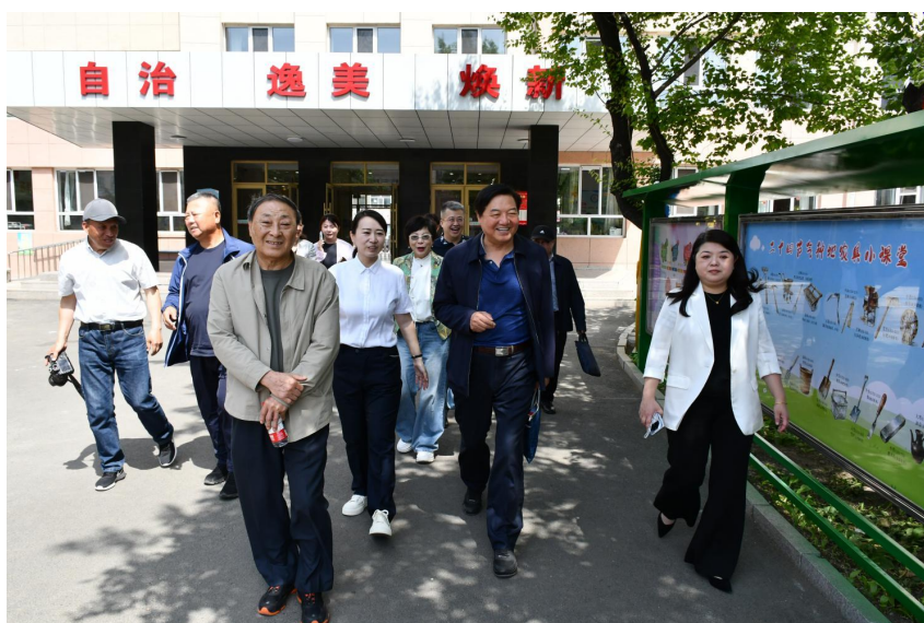
当日上午，调研组依次调研江南实验学校、第四中学、