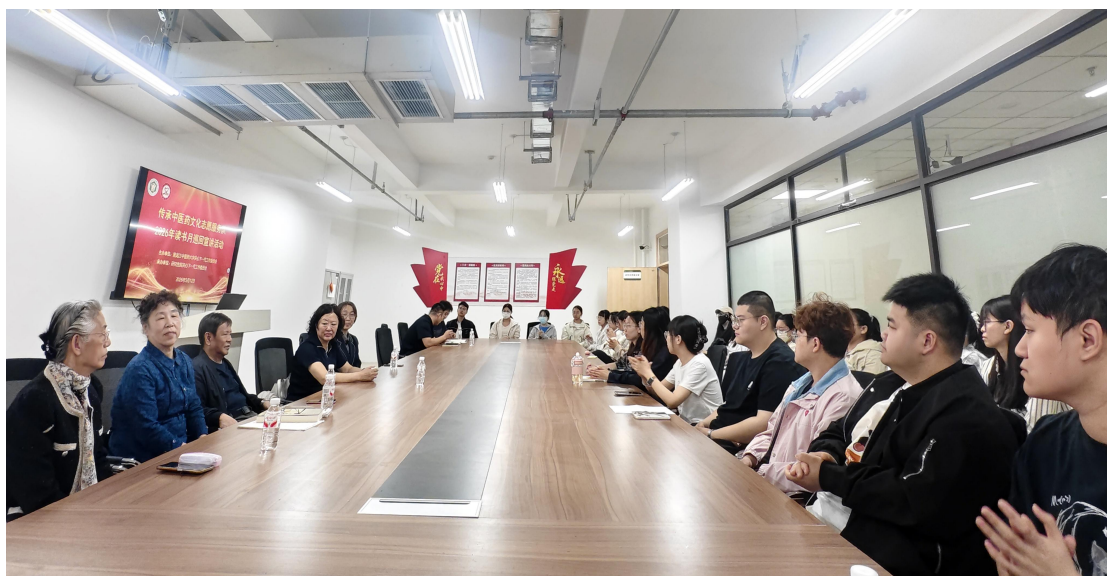
与会师生认真聆听宣讲报告和专题讲座