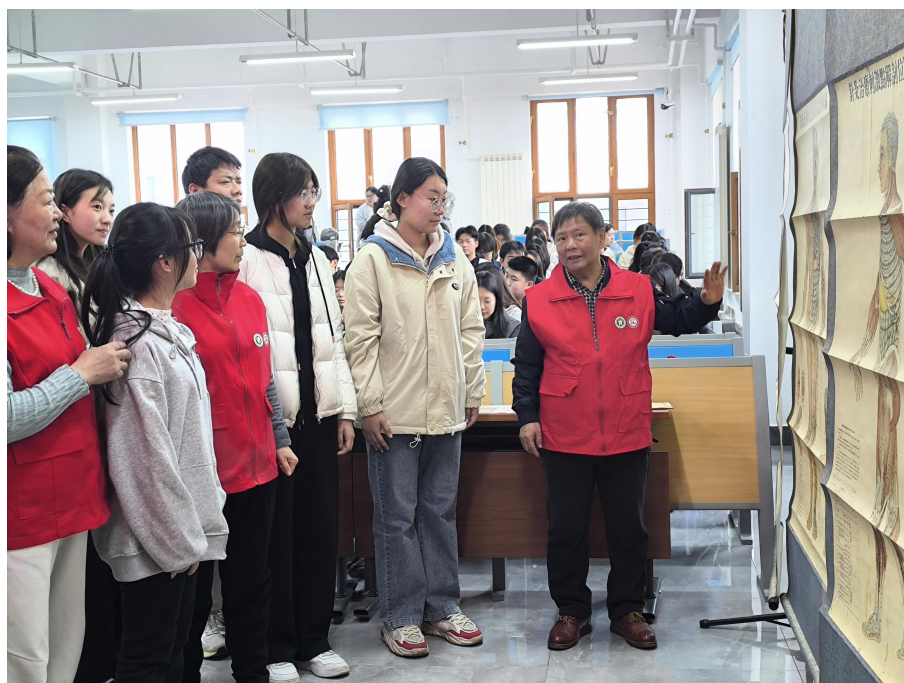
志愿服务队成员为师生作实物档案讲解