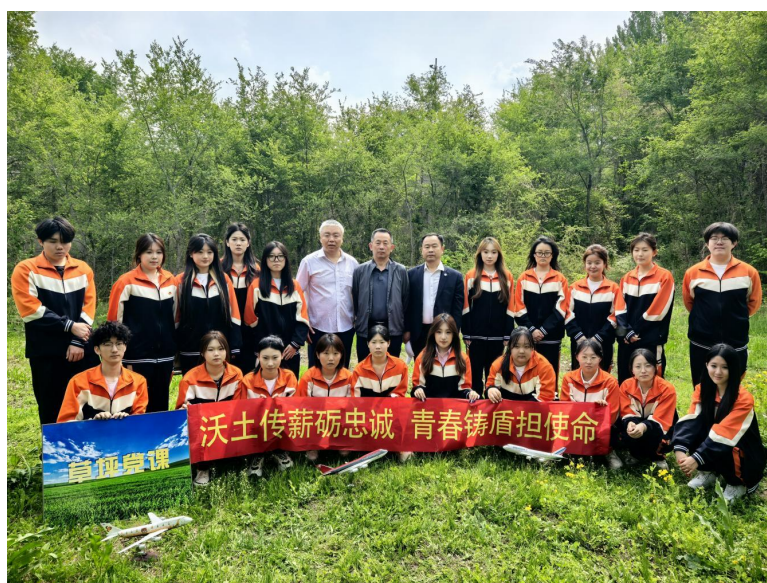
黑龙江职业学院关工委供稿

人根本任务、加强青年思想政治引领的重要举措。活动以沉浸式、体验式教育，让红色信仰扎根青春心田，让国防意识融入青年血脉。下一步，黑龙江职业学院关工委将持续深耕育人一线，创新教育形式、丰富教育内容，引导广大青年学子传承红色基因、勇担时代使命，以奋斗之姿为强国建设、民族复兴贡献青春力量。